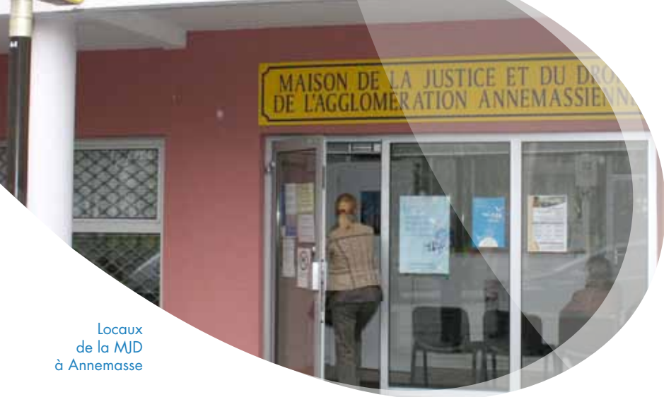
Locaux de la MJD à Annemasse

MAISON DE JUSTICE ET DU DROIT D'ANNEMASSE AGGLO 3, rue du Levant - 74100 ANNEMASSE tél. 04 50 84 06 70 - fax. 04 50 84 06 71